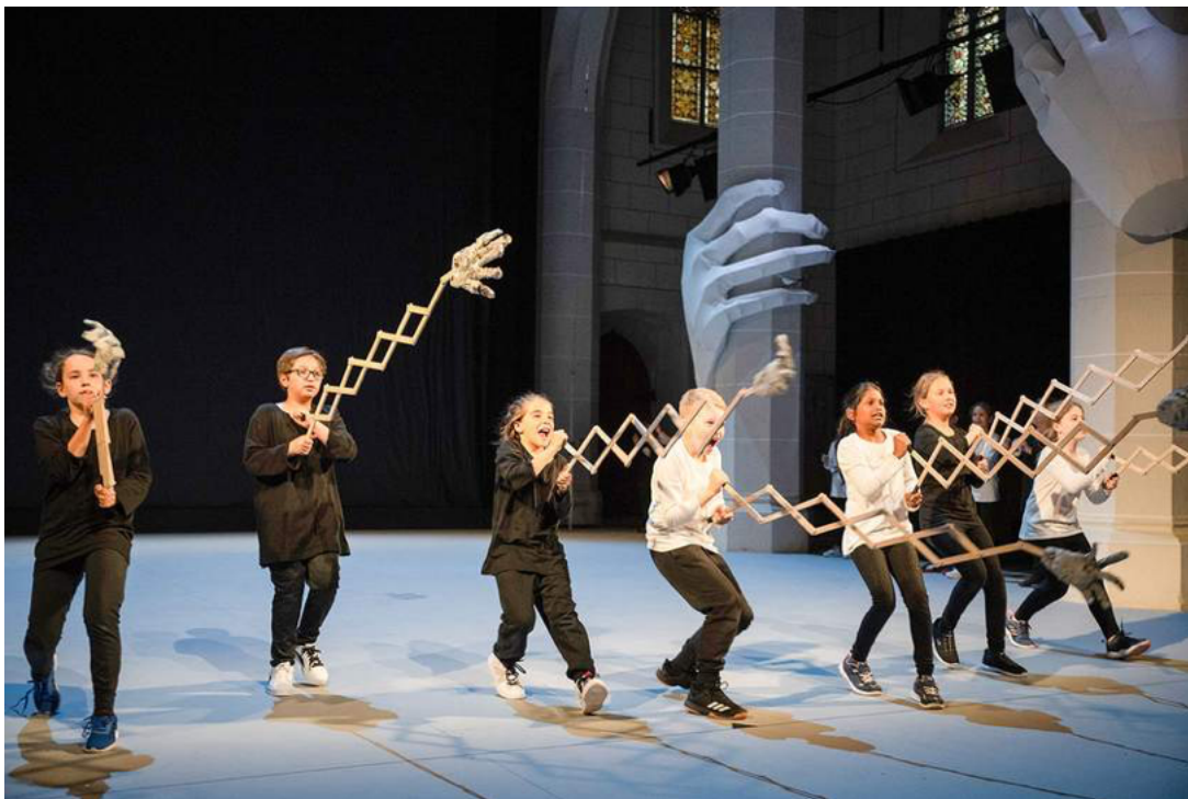
Mit den Händen die Welt begreifen. «Gib mir die Hand» feierte am 9. Juni Premiere. Das Thema wurde vielfältig, «handlich» und originell inszeniert.

Das pädagogische Tanz- und Kunstprojekt zählt zu den kulturellen Leuchttürmen des Kantons Aargau. Ein handfestes Thema gab den Ton an.